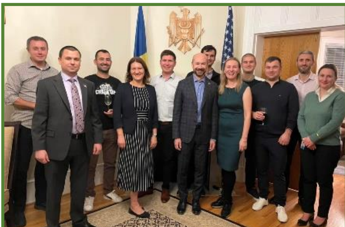
Reprezentanții comunității moldovenii din Washington DC s-au reunit la Ambasadă.