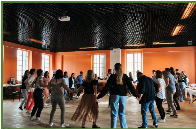
Membrii Asociației „Maison Moldave France Sud-Ouest” au organizat evenimentul cu genricul „Sărbătoarea plăcintelor”.