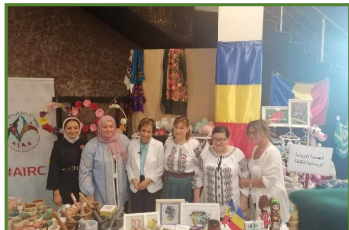
Asociația iordaniano-română pentru cultura a participat la cea de-a 58-a ediție a Bazarului Diplomatic.