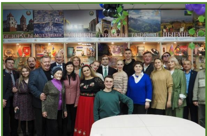
Cea de-a III-a ediție a festivalului „Vița de vie”, organizat de către asociația „Autonomia național-culturală a moldovenilor „Pрут” din or. Riazan.