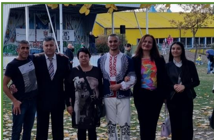
Asociația diasporei moldovenești din Bulgaria “Роден Край” a organizat un concert cu ocazia Zilei Bulgarilor Basarabeni.